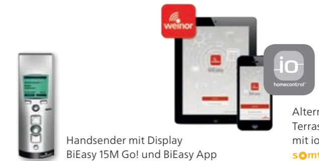
Handsender mit Display BiEasy 15M Go! und BiEasy App

Alternativ können Sie Ihre Terrasstechnik auch mit io-homecontrol ® von somfy steuern.