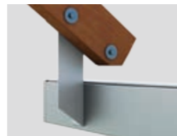
Dachsparrenmontage (bei überstehendem Dach)