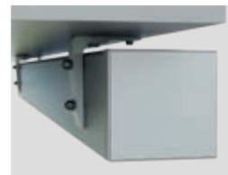
Deckenmontage (auf und unter dem Dach)

Neben der herkömmlichen Wandmontage lässt sich Kubata auch bei besonderen baulichen Voraussetzungen problemlos anbringen.